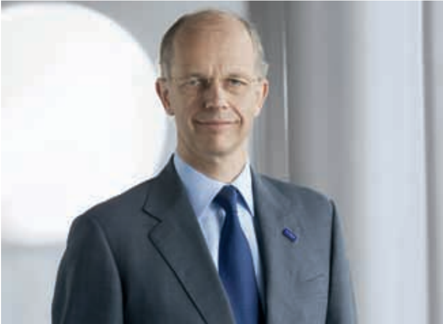
Dr. Kurt Bock

BASF, yılın 2. çeyreğinde şirket satışlarını %6 arttırarak 19.5 milyar Euro'ya çıkarttı ve özel kalemler öncesi faaliyetlerden elde ettiği geliri de (FVÖK) 253 milyon Euro'luk bir artışla 2.5 milyar Euro'ya çıkı. Kimyasallar, Plastikler, Performans Ürünleri ve İşlevsel Çözümler segmentlerinden oluşan kimya işinde satış hacimleri azalsa da, Tarım Çözümleri ve Petrol ve Doğalgaz segmentlerindeki performans şirkete katkı sağladı. 2012 yılının ilk yarısında, satışlar önceki yılın aynı dönemine oranla %6 artış göstererek 40.1 milyar Euro seviyesinde gerçekleşti. 5 milyar Euro'nun üzerinde gerçekleşen özel kalemler öncesi FVÖK ise 2011 yılının ilk yarısında elde edilen seviyede gerçekleşti.