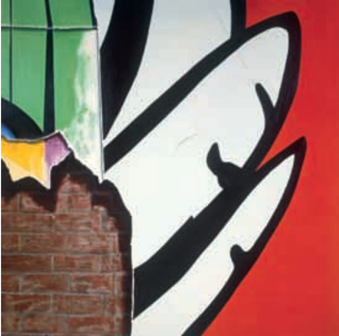
Duvarlardan 70: No. 45, 1970 Tuval üzerine akrilik 152.4 x 152.4 cm. Dr. Nejat F. Eczacıbaşı Vakfı Koleksiyonu

İstanbul Modern, yeni sergisinde çağdaş Türk sanatının önde gelen isimlerinden Burhan Doğançay'ın 50 yıllık çalışmalarından oluşan kapsamlı bir sergi sunuyor. Kent Duvarlarının Yarım Yüzyılı: Burhan Doğançay Retrospektifi, sanatçının 14 ayrı dönemi