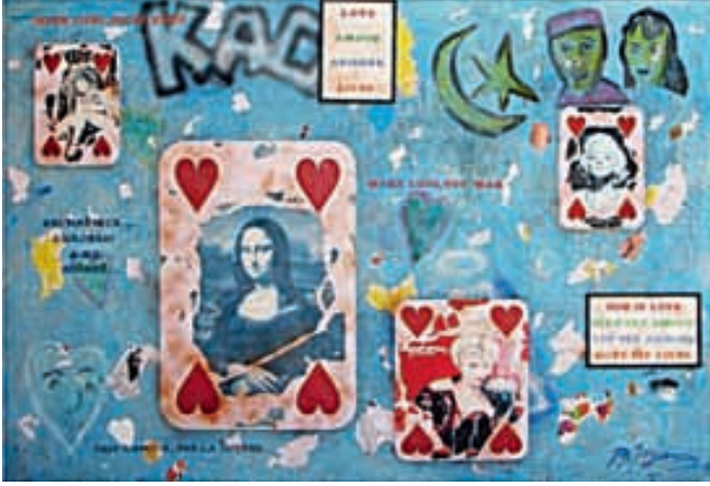
Kupa Kızları. 2010 Tuval üzerine kolaj, akrilik, ahşap çerçeveler, kahve lekeleri ve spray 150 x 220 cm