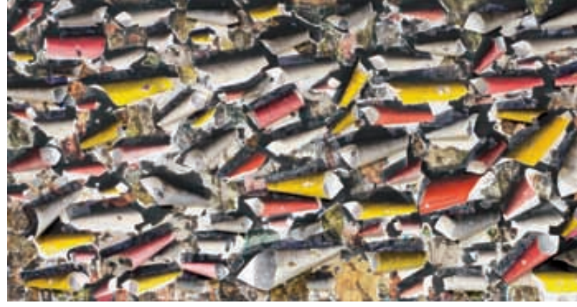
Madonna. 1987 Tuval üzerine kolaj, akrilik, guvaş ve fümaj 122 x 229 cm (48 x 90.2 in.) Dr. Nejat F. Eczacıbaşı Vakfı Koleksiyonu