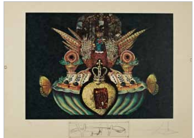
Gala ile akşam yemeği 2

Sürrealizm İzleri Dalı sembolizminin ve sürrealizminin örnek niteliğindeki çalışmaları olarak kabul edilmektedir. Burada yer alan koltuk değnekleri, saatler, kelebekler, Gala ve Dalı'nın kendisi, sanatsal izleğine ışık tutan önemli sembollerdir.