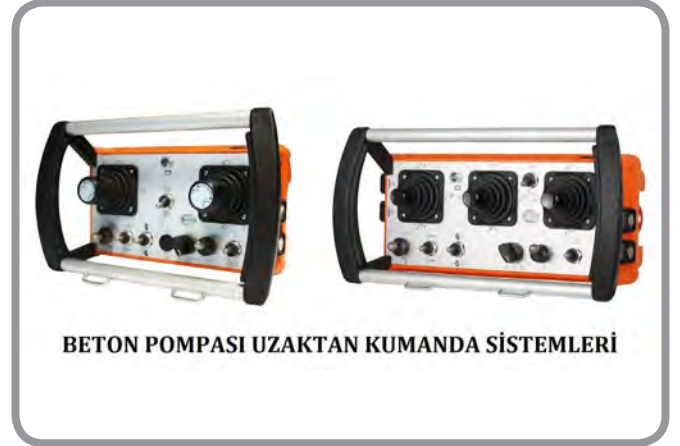
BETON POMPASI UZAKTAN KUMANDA SİSTEMLERİ

HBC-radiomatic'in bir diğer özelliği ise "data logger ve kullanıcı kart" ile istenmesi durumunda kumandanın hangi saatte devreye