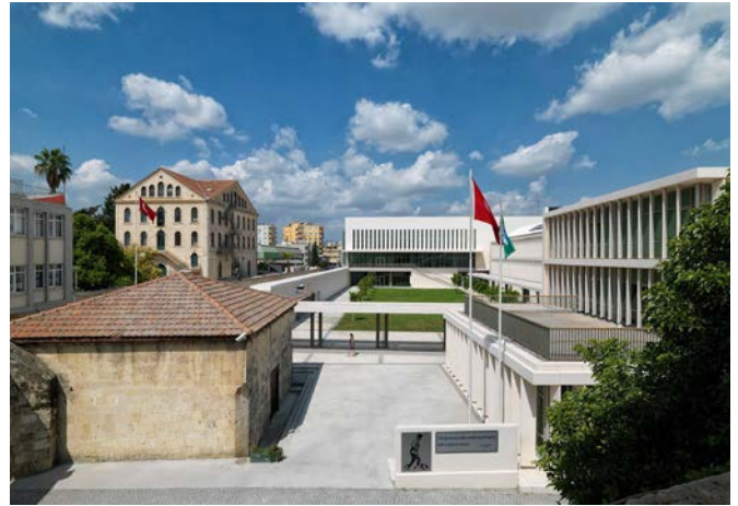
• TAC-SEV Yeni Kampüsü (Erginoğlu & Çalışlar Mimarlık)