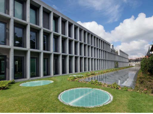
• Doğan Holding Genel Müdürlük Yapısı (NSMH)