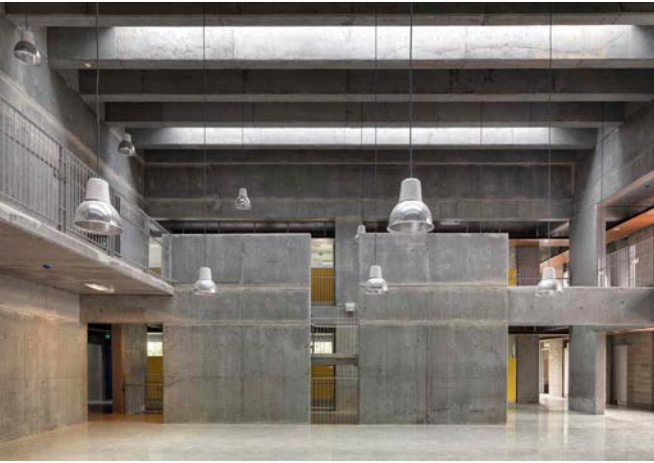
• Güngören Tozkoparan İlköğretim Okulu (Uygur Mimarlık)