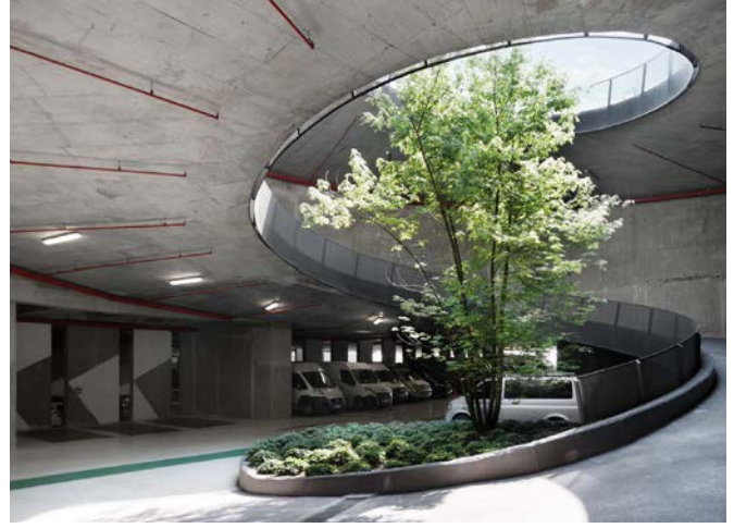
• Şişhane Park Kentsel Meydan ve Yeraltı Otoparkı (SANALarc)