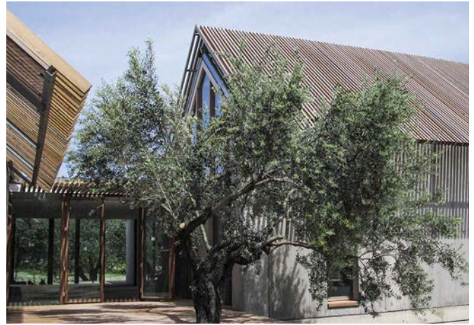
• T - Evi (Onur Teke)