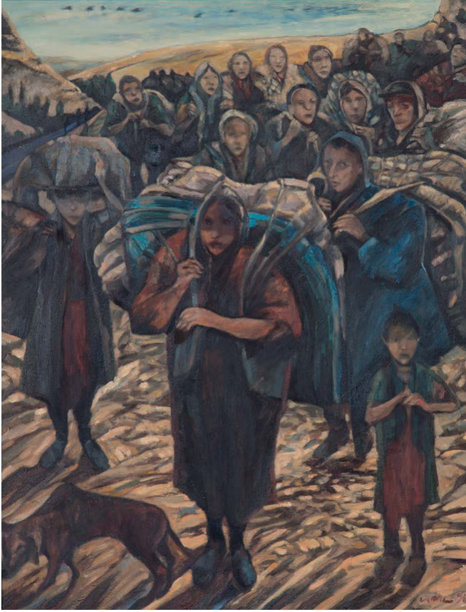
053 Göç II, 1996, 116 x 89 Tuval Üzerine Yağlıboya

İş Sanat Kibele Galerisi, çağdaş figüratif resmin önde gelen temsilcilerinden Cihat Aral'ın eserlerini sanatseverlerle buluşturuyor. Kendi deyimiyle zamana tanıklık eden sanatçı, resimlerinde insanı ve doğa sevgisini tuvale yansıtıyor.